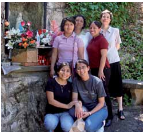
Misioneras participantes en la JMJ venidas de Perú, Argentina y México en la gruta de Ciudad Misioneras

Y ahora deseo anunciar los temas de las próximas Jornadas Mundiales de la Juventud. La del año próximo, que tendrá lugar en cada diócesis, tendrá como lema "¡Estad alegres en el Señor!", tomado de la Carta a los Filipenses (4,4); mientras que en la Jornada Mundial de la Juventud de 2013 en Río de Janeiro, el lema será el mandato de Jesús: "Id y haced discípulos a todos los pueblos!" (cfr Mt 28,19). Desde ahora confío a la oración de todos la preparación de estas citas muy importantes. Gracias