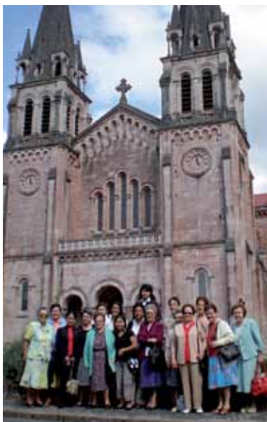
En el encuentro con nuestras Misioneras de la JMJ visitando a la Virgen de Covadonga.

Nos alegró mucho escuchar del propio Papa Benedicto XVI la noticia de que pronto San Juan de Ávila, que ya es patrono del Clero español, será proclamado Doctor de la Iglesia.