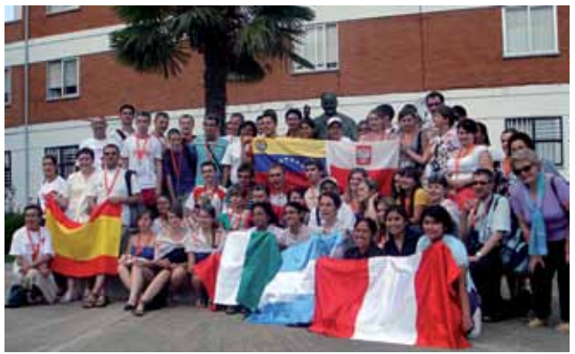
Visita de jóvenes de Polonia, México y Venezuela participantes en la JMJ

El día siguiente, la Santa Misa en la Catedral de la Almudena, en Madrid, con los seminaristas: jóvenes que quieren arraigarse en Cristo para hacerlo presente un mañana, como sus ministros. ¡Auguro que crezcan las vocaciones al sacerdocio! Entre los presentes había más de uno que había oído la llamada del Señor precisamente en las precedentes Jornadas de la Juventud; estoy seguro de que también en Madrid el Señor ha llamado a la puerta del corazón de muchos jóvenes para que le sigan con generosidad en el ministerio sacerdotal o en la vida religiosa. La visita a un Centro para los jóvenes discapacitados me hizo ver el gran respeto y amor que se nutre hacia cada persona y me dio la ocasión de dar las gracias a los miles de voluntarios que dan testimonio silenciosamente del