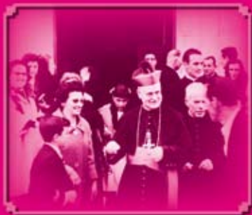
Conferencias sobre el Siervo de Dios Ángel Riesco Carbajo