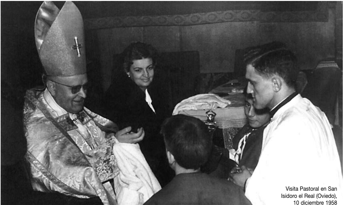
Visita Pastoral en San Isidoro el Real (Oviedo), 10 diciembre 1958