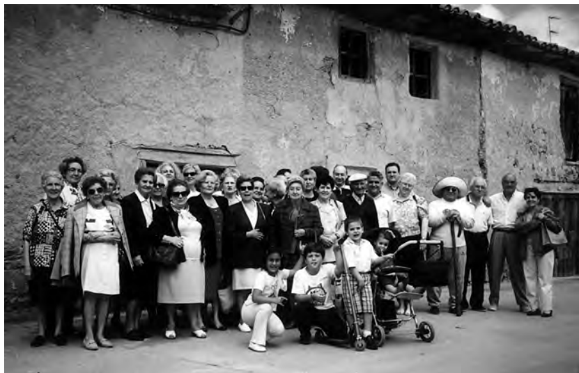
Los amigos de Don Ángel en Bercianos junto a la casa del Padre. Año 2000

La Asociación “Amigos de Don Ángel” está programando el viaje que, todos los años, realizamos a Bercianos el pueblo de Don Ángel: será, si Dios quiere, el próximo 5 de Junio, domingo de la Ascensión del Señor, es el más cercano al día 3, fecha en la que allí, en su parroquia de Bercianos, celebró la primera Misa recién consagrado Obispo. La Eucaristía, de este domingo 5, estará solemnizada por el Grupo La Rueca, de aquella misma