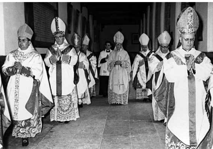
Bodas de Diamante del Seminario de Comillas (31-7-1967)